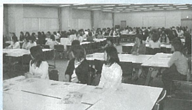
多数の参加者で埋め尽くされた会場

第2部では、広報紙コンクールの概要について広報・情報委員会よりの説明があり、受賞作品の展示がありました。