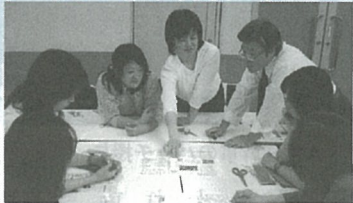
真剣に作業をしています

5月7日(月)平成19年度さいたま市PTA協議会広報紙づくり講習会がソニックシティ市民ホールにて開催されました。