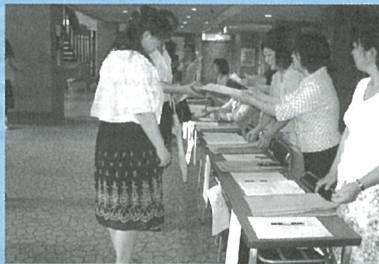
受付をする各学校PTA関係者

今年度新しく役員になられた方も、何回目という方もこの1年PTA活動を明るく元気に活動していきたくなるようなセミナーでした。