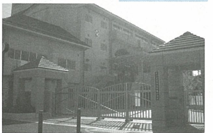
さいたま市立辻南小学校校門