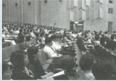
会場風景 なセミナーとなった。