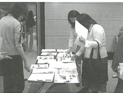
広報紙コンクール受賞作品をロビーにて展示

また、会場ロビーでは、広報紙コンクール受賞作品の展示があり、参加者は真剣な表情で作品を見比べていた。