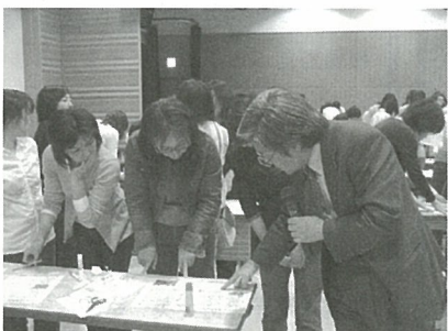
講師の話に熱心に聞き入る参加者