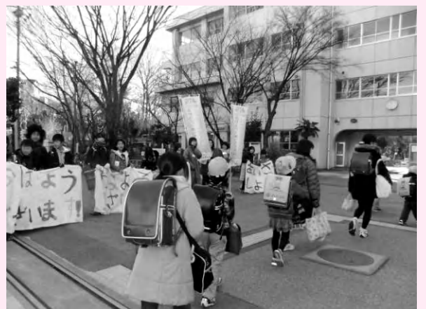
代表委員が手作りの幕を持って元気にあいさつ(中島小PTA)