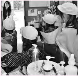
理髪店を探検する子どもたち

10月24日(木)、2年生による「まち探検」が行われました。住んでいる街にどんなお店があつてどんな仕事をしているのか、子どもたちが探検します。道中あぶなくないように、またお店に失礼のないように、保護者たちが見守りました。