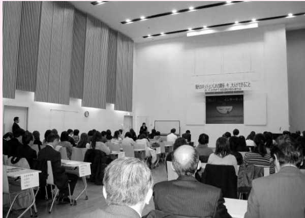
校長、PTA 会長をはじめ各校PTA会員約 200 名が参加

発行:さいたま市PTA協議会桜区連合会 事務局:さいたま市大宮区大門町3-1 TEL 048-647-4401 編集:桜区PTA連合会 広報情報委員会