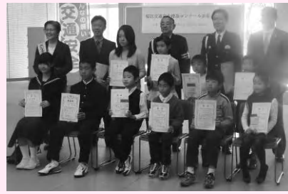
交通安全標語コンクール表彰者

11月30日(土)、平成25年度桜区交通安全標語コンクールの表彰式がプラザウエストにて行われました。