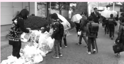
毎月第二火曜日の登校時にアルミ缶を回収する土合小PTA(上)と神田小PTA(下)